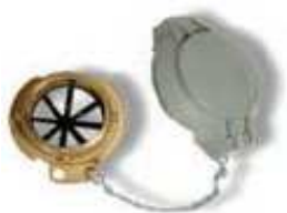
BOCA DE CARGA 2"