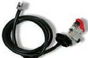
KIT ASPIRACION 2"