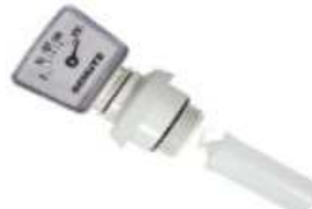
INDICADOR DE NIVEL 2"