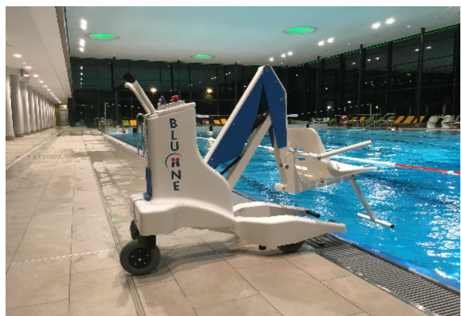
BLUONE NEW nuevo diseño, incluye funda